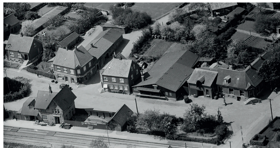
Den oprindelige stationsplads med stationsbygninger.

mellem forvaltning og fællesråd, vil det være interessant hvis Landsbyforum informerer/præsenterer og diskuterer et kommende forslag på et møde for interesserede eller her i bladet.