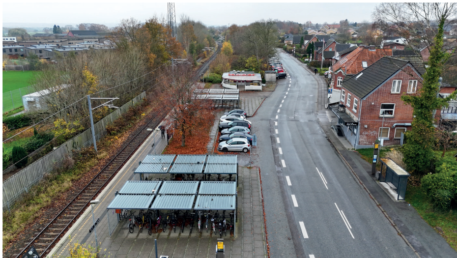
Den nuværende stationsplads.

Der er kommet mange forslag til at omforme stationspladsen i Hjortshøj, efter pop-up event og samtaler med skolebørn.