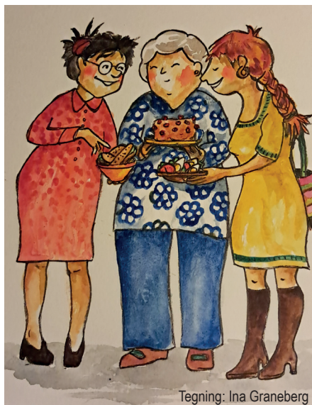
Tegning: Ina Graneberg

Vi mødes, og synger et par sange ved bålet for at markere vintersolhvervet hvorefter dagene igen bliver lysere. Har du lyst til at hjælpe med at gøre bålet klar kan du kontakte Kurt (kurtelmstroem@gmail.com).