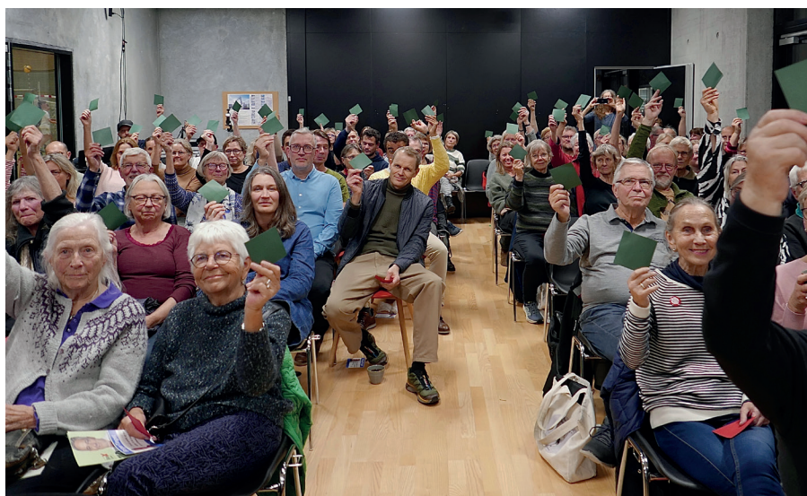
Vælgermøde i Viruphuset: Afstemning om cykelsti på Mejlbjvej. De fleste var for - også politikerne.